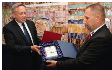
Wyróżnienie dla klubu od Świętokrzyskiego Zrzeszenia LZS.