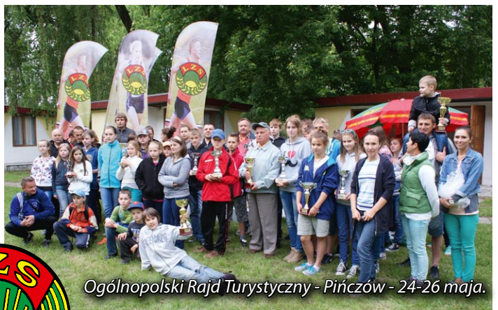
Ogólnopolski Rajd Turystyczny - Pińczów - 24-26 maja.