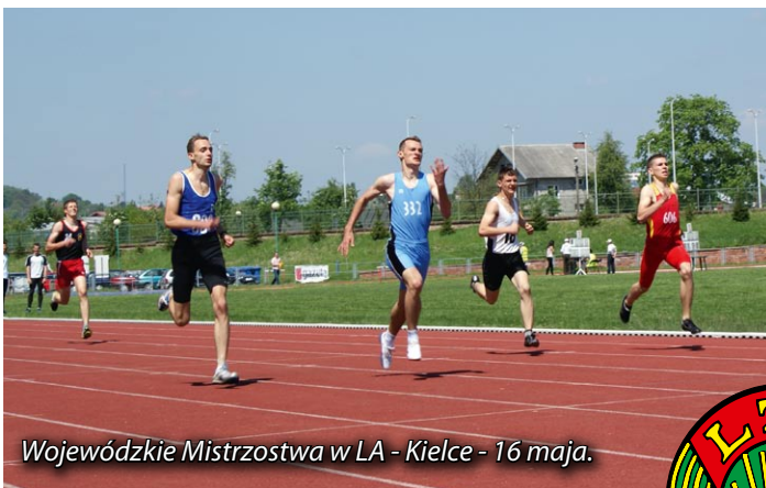
Wojewódzkie Mistrzostwa w LA - Kielce - 16 maja.