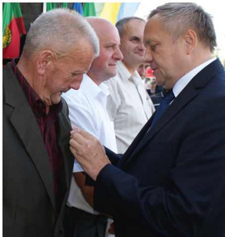
Dekoracja działaczy „Piaskowianki”.