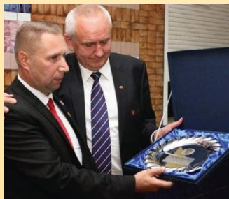
35 LAT „WIERNEJ”