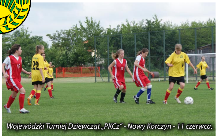
Wojewódzki Turniej Dziewcząt „PKCz” - Nowy Korczyn - 11 czerwca.