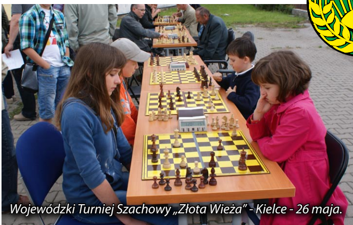
Wojewódzki Turniej Szachowy „Złota Wieża” - Kielce - 26 maja.