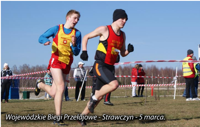
Wojewódzkie Biegi Przełajowe - Strawczyn - 5 marca.