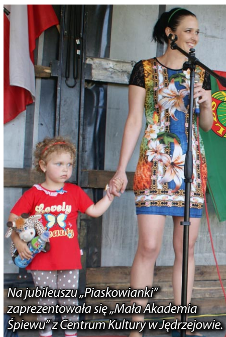
Na jubileuszu „Piaskowianki” zaprezentowała się „Mała Akademia Śpiewu” z Centrum Kultury w Jędrzejowie.