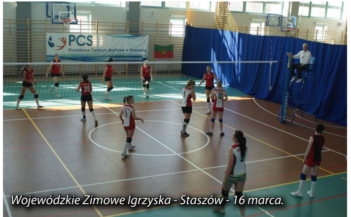
Wojewódzkie Zimowe Igrzyska - Staszów - 16 marca.