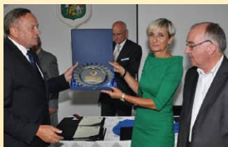
JUBILEUSZ W PACANOWIE