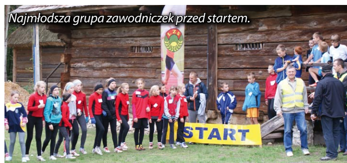
Najmłodsza grupa zawodniczek przed startem.

Tradycyjny Memoriał Zdzisława Stawiarza w biegach przełajowych w 2013 roku odbył się 19 września w Tokarni gmina Chęciny. W urokliwej scenerii na specjalnie przygotowanych trasach na obszarze Parku Etnograficznego, startowało ponad 250 młodych biegaczy, reprezentujących szkoły podstawowe, gimnazja i szkoły ponadgimnazjalne z woj. świętokrzyskiego. Tak więc po raz 16-ty uczczono pamięć tragicznie zmarłego przed laty zasłużonego działacza i sternika Zrzeszenia LZS w woj. kieleckim.