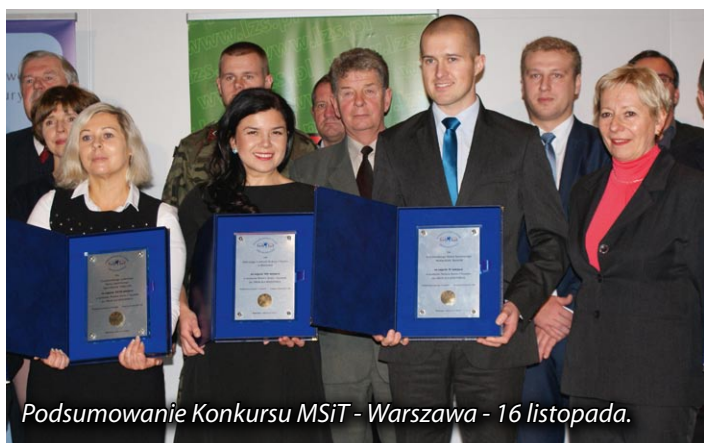
Podsumowanie Konkursu MSiT - Warszawa - 16 listopada.