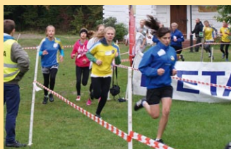
MEMORIAŁ Z. STAWIARZA