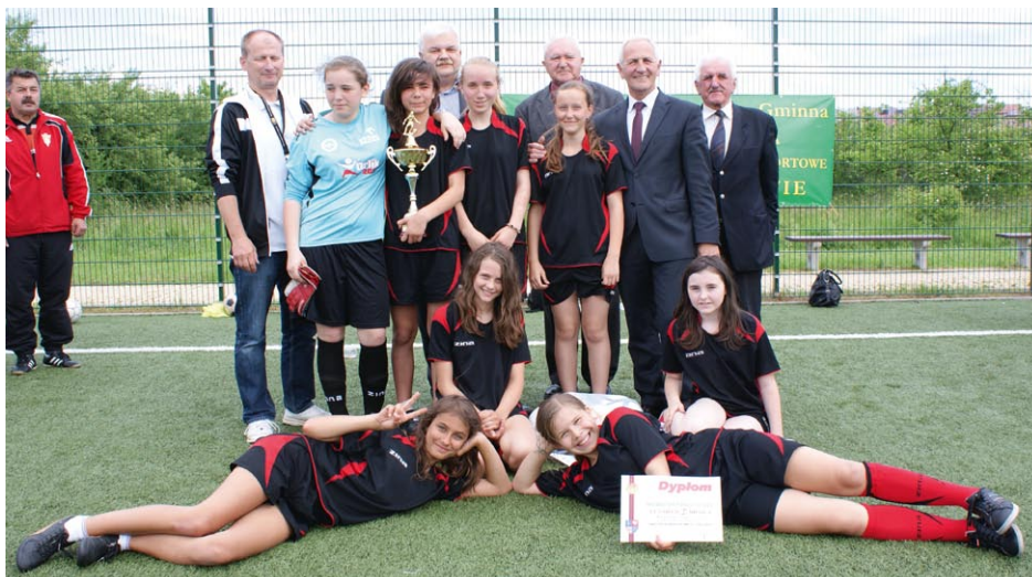
Zwycięska drużyna dziewcząt ze Staszowa Turnieju „Mała Piłkarska Kadra Czeka” z gospodarzami powiatu i gminy.

Trzy najlepsze finałowe drużyny chłopców rozegrały między sobą mecze. Oto