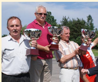
IGRZYSKA W ŁOPUSZNIE