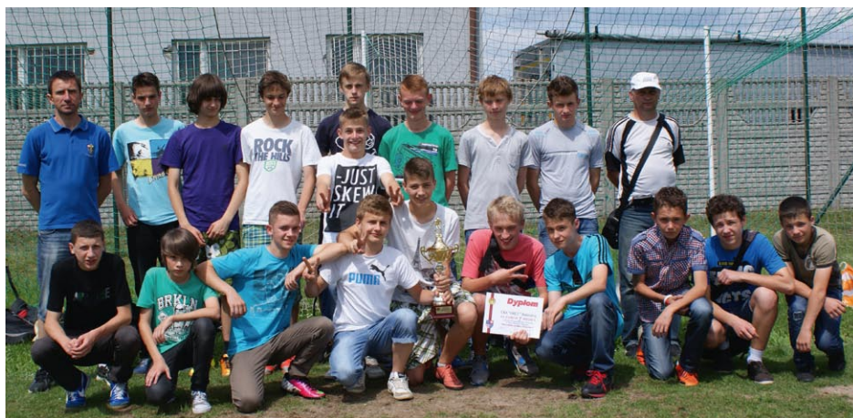
„Orły” z Bodzentyna najlepszą drużyną w „PKCz” 2013 roku.