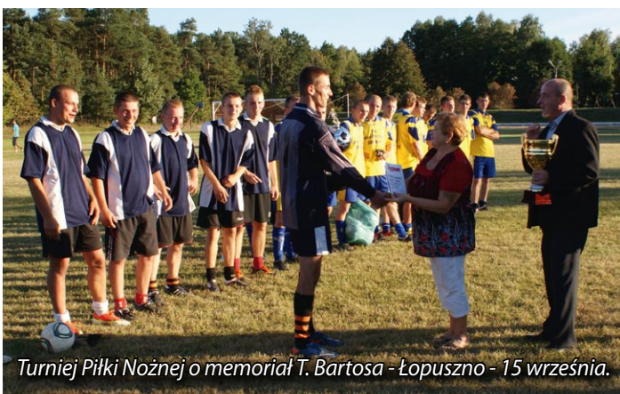
Turniej Piłki Nożnej o memoriał T. Bartosa - Łopuszno - 15 września.