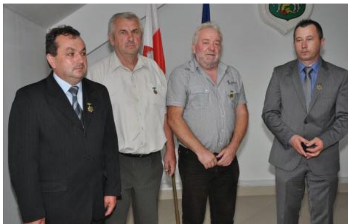
Zasłużeni działacze z „Zorzy-Tempa” Pacanów.