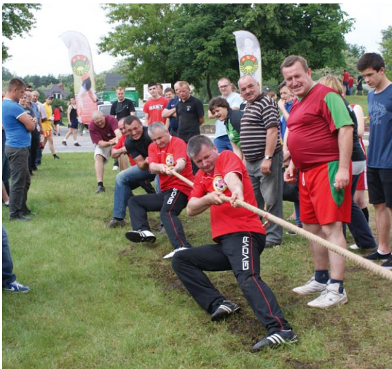
Drużyna LZS Lechów najlepsza w przeciąganiu liny.