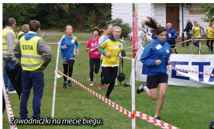
Zawodniczki na mecie biegu.

Drużynowo: 1. „Maraton” Strawczyn – 221 pkt, 2. PG Rytwiany – 139 pkt, 3. Gimn. Daleszyce – 132 pkt, 4. Gimn. 2 Obłęgorek – 121 pkt, 5. „Słoneczko” Busko Zdrój – 84 pkt, 6. UKS „Lider” Łopuszno – 83 pkt.