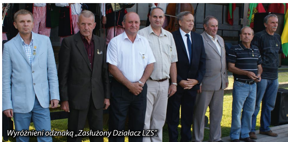
Wyróżnieni odznaką „Zasłużony Działacz LZS”.